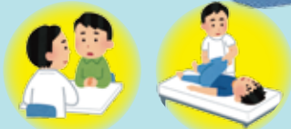
病気の知識を広める 身体のリハビリ